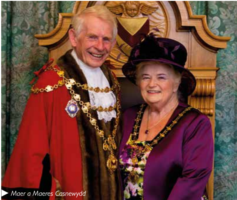
Maer a Maeres Casnewydd

Ceir manylion llawn o bob portffolio yn www.newport.gov.uk