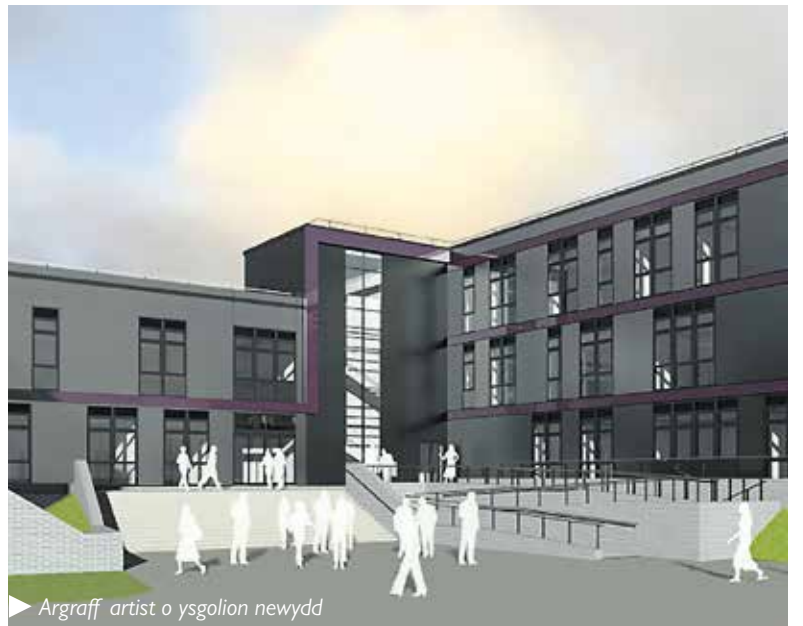
Argraff artist o ysgolion newydd