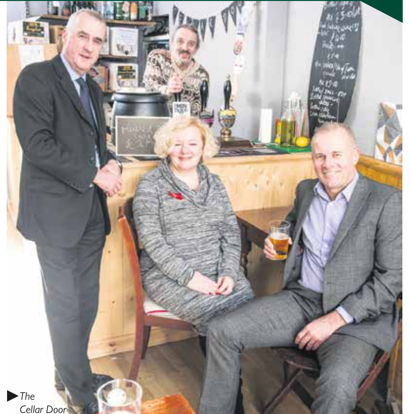
The Cellar Door