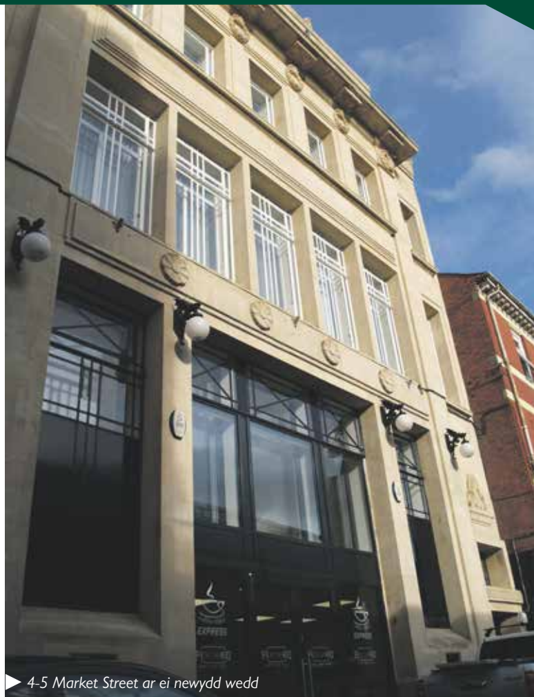
▶ 4-5 Market Street ar ei newydd wedd

Rhoddodd y cyngor gymorth iddynt wrth ddod o hyd i eiddo datblygu addas ac mae'n parhau i weithio'n agos â'r busnes teuluol wrth iddo fynd ati i ehangu ei bresenoldeb yng Nghasnewydd. www.newport.gov.uk/business