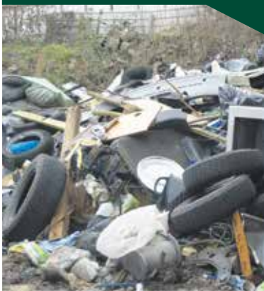
► Caiff pobl sy'n tipio'n anghyfreithlon eu dal a'u herlyn

Cyngor Dinas Casnewydd yn rhybuddio y dylai preswylwyr sicrhau eu bod yn talu gweithredwyr trwyddedig i fynd â sbwriel ymaith.